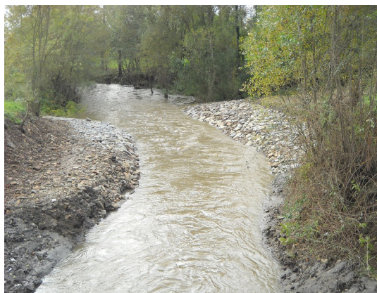
Comme exemple d'effacement, le clapet de la Motte, sur la Sanguèze avant et après travaux est un cas intéressant.